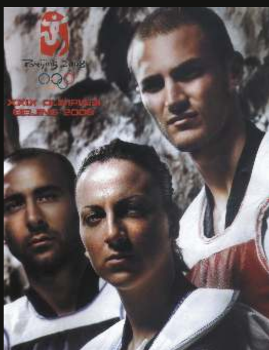
Italian Olympic Team